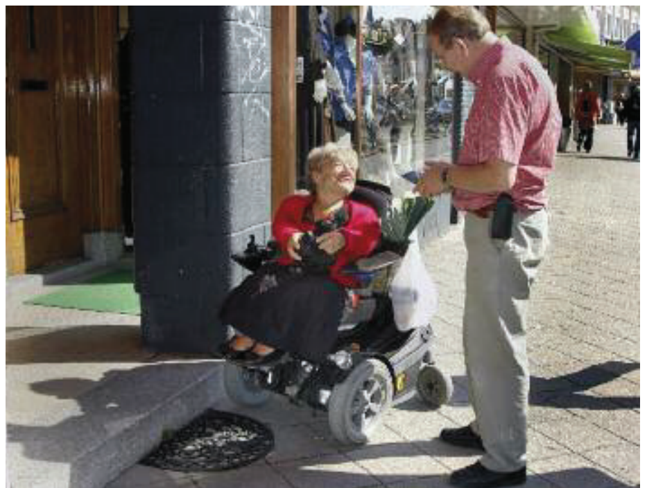
Buurthulpprojecten zijn vooral succesvol als de hulpverlener een rol op de achtergrond heeft