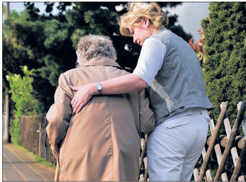
► Op websites kunnen vrijwilligers zich aanbieden om bijvoorbeeld met ouderen te gaan wandelen

► Websites die vraag en aanbod van hulp koppelen, springen in het gat van de participatiesamenleving