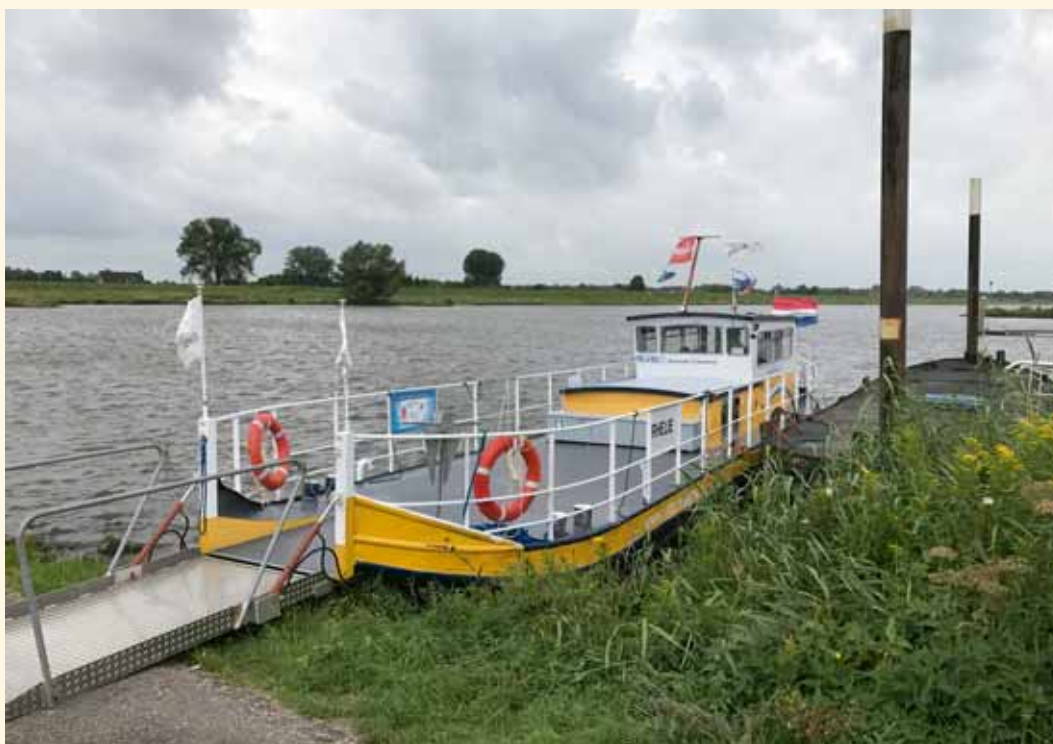
'Bij Rhenen steek ik de Rijn over met het veer.'

Meer informatie over de route en het pelgrimspakket op Gelukkigierwijspad.nl .